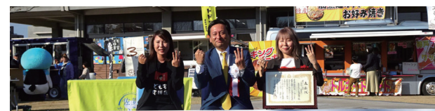
令和5年度 佐賀さいこう表彰 表彰式 「自発の地域づくり・協働部門」 令和5年11月26日

「佐賀さいこう表彰」は、佐賀県における地域課題解決に向けた取り組みを行い、顕著な成果を挙げている、又は地域の下支えとして活動しているCSO等を対象にした表彰です。こども宅食応援団は、「こども宅食事業の普及をはじめ、地域の実情に即した仕組みづくりのノウハウを実施団体へ提供し、地域をつなげるネットワークの構築に貢献した」という点が評価され、今回の受賞となりました。